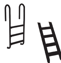
Échelle & Escalier (en option)