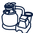
Groupe de filtration YZAKI 5,7m 3 /h